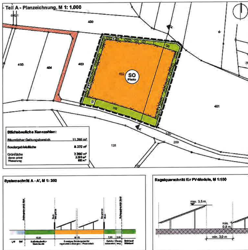
Abb. 2: Ausschnitt Planzeichnung B-Plan „Solarpark Pessenburgheim Igl“ (becker + haindl, Entwurf 26.09.2023)

Auf einer Grünlandfläche östlich von Pessenburgheim mit einer Größe von 1,13 ha soll eine Freiflächen-Photovoltaikanlage mit einer Fläche von 0,84 ha errichtet werden (s. Abbildung 2).