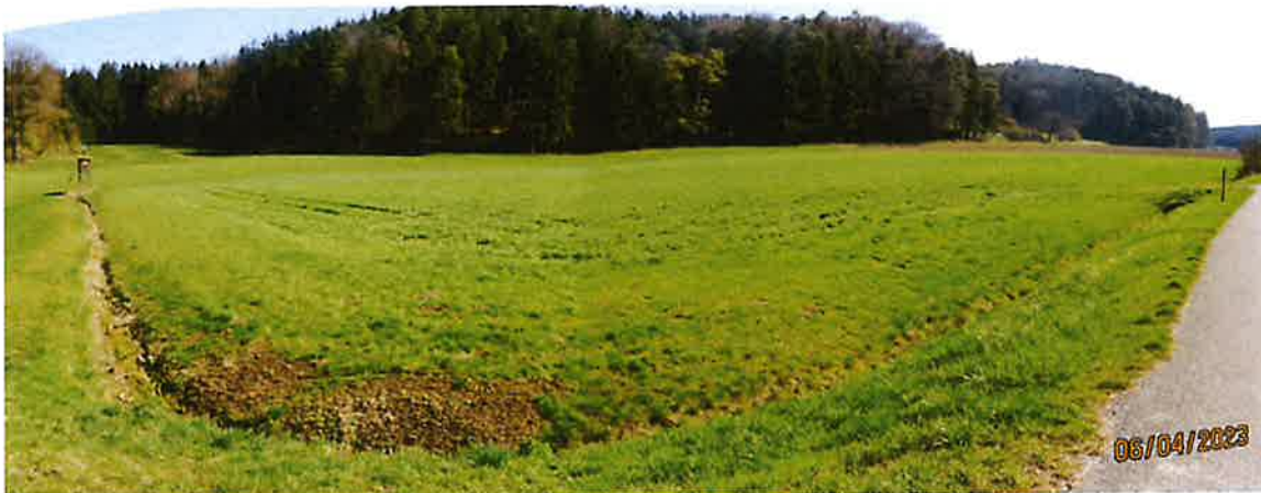
Abb. 5: Graben westlich Planungsfläche Solarpark Igl