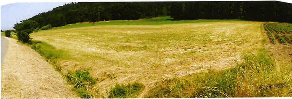
Abb. 4: Übersicht Planungsfläche Solarpark Igl (22.06.2023)