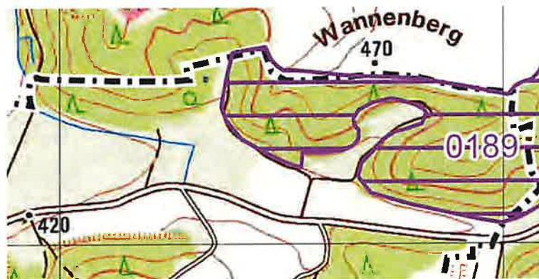
Abb. 3: Auszug ASK TK 7133 (LfU 2023)

Für das Planungsgebiet und dessen Umfeld ist in der Artenschutzkartierung (ASK) ein Eintrag über Vorkommen der Gebänderten Prachtlibelle ( Calopteryx splendens ) verzeichnet (s. Abbildung 3, 0189).