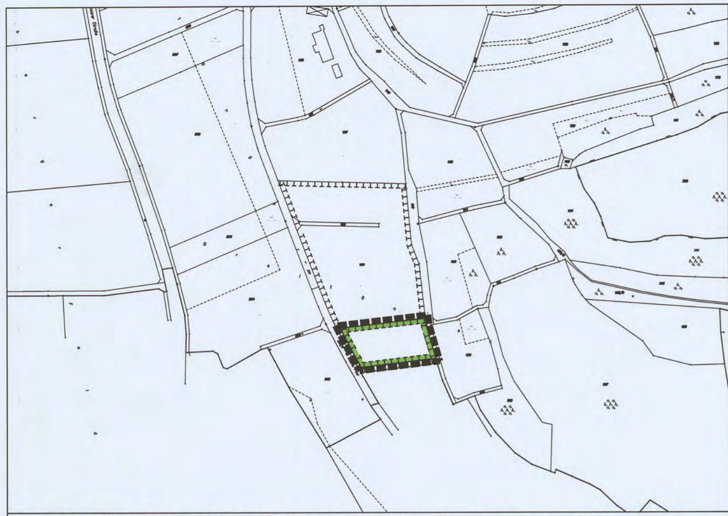
A2 - Teilräumlicher Geltungsbereich des Bebauungsplanes Ausgleichsfläche Flurstück Nummer 199 (TF), Gemkg. Holzheim, M 1:2.000